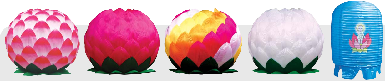
칼라(보카시)연등 공단등 오색공단등 영가등 중등