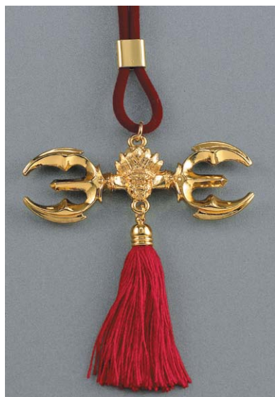
부처님 제1의 비방법구