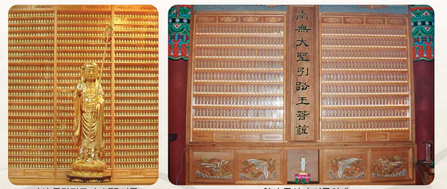
마산 금강정토사 LED인등 천안 동심사 영구위패

찬덕연등에서는 KS케이블을 사용하여 가장 안전하게 전문 기술인에 의해 직접 감독 시공합니다.