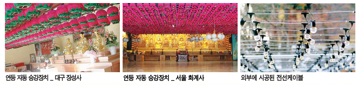
연등 자동 승강장치 _ 대구 정성사 연등 자동 승강장치 _ 서울 화계사 외부에 시공된 전선케이블

찬덕연등에서는 KS케이블을 사용하여 가장 안전하게 전문 기술인에 의해 직접 감독 시공합니다.