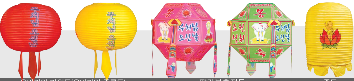
육바라밀 만월등(육바라밀 주름등) 팔각봉축접등 중등