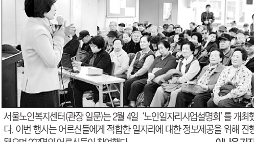
서울노인복지센터(관장 일문)는 2월 4일 '노인일자리사업설명회'를 개최했다. 이번 행사는 어르신들에게 적합한 일자리에 대한 정보제공을 위해 진행됐으며 227명의 어르신들이 참여했다. 이은은 기자