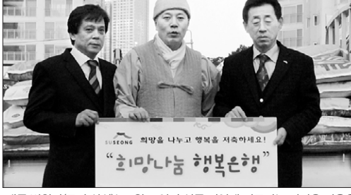
대구 법왕사(주지 실상)는 1월 23일 수성구 지역에 거주하는 어려운 이웃을 위해 쌀 20kg 100포를 수성구청을 통해 전달했다. 법왕사는 매년 신도들의 정성을 모아 몇차례씩 보시행을 실천하고 있다. 이상연 기자