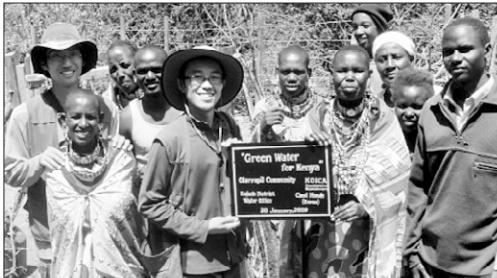
(사)지구촌공생회(이사장 월주)는 1월 26일 케냐 마사이족 올로로펠(Olorop) 마을에 핸드프롬 8기를 완성했다. 10개월간의 난공사 끝에 완공된 이번 핸드프롬은 2400여 마사이족들이 깨끗한 물을 마실 수 있게 됐다. 노덕현 기자