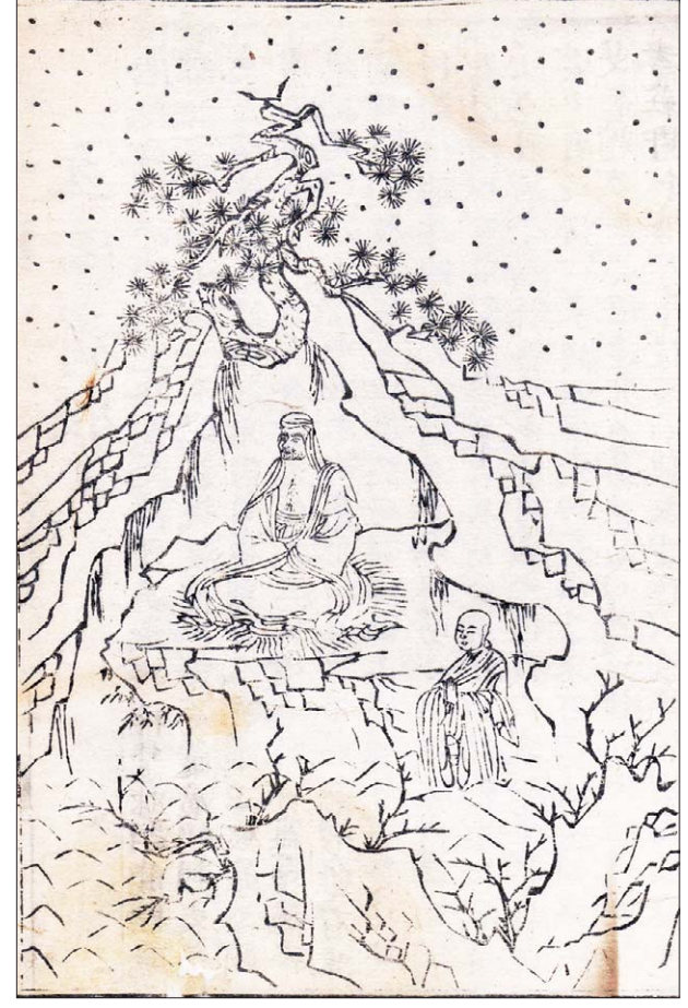
고려판화박물관 소장, 석씨원류(雪溪元流) 판화(半幅) 27.2x18.0cm

<석씨원류>에 등장하는 이 삽화는 달마 대사에 대해 스님이 결연한 수행 의지를 보여주기 위해 자신의 팔을 잘라 바치기 직전 눈 속에서 달마의 승낙을 기다리는 장면이다. 해가 스님은 속성 희(翫), 조명 신광(神光), 허난성(河南省) 위양(滎陽) 부근 무로(武牢)에서 출생했으며, 중국 선종(禪宗)의 제2조(祖)로, 젊어서는 노장(老莊)과 유학을 공부했으나 후에 출가했다. 520년 선종의 개조(開祖)인 달마(達磨)의 제자가 돼 6년간 수행한 끝에 스승의 선법(禪法)을 계승했다. 달마의 제자가 됐을 때, 눈 속에서 왼팔을 절단하면서까지 구도(求道)의 성심을 보이고 인정을 받았다는 전설로 유명한데, 이것은 후에 해가단비(慧可斷臂)라는 화제(畫題)가 됐다. 중국영화를 보면 소림사 스님들이 한 손에는 붓을 들고 한 손으로 합장하는 모습을 볼 수 있는데, 이러한 행동은 한쪽 손이 없었던 해가 스님을 기리는 뜻으로 그렇게 한다고 전해져 있다. 본문을 살펴보면 '달마는 눈 속에서 승낙을 기다리던 신광 스님을 돌아보며 말했다. '모든 부처님의 위없는 묘도는 비록 광경을 부지런히 정진해 행하기 어려운 일을 행할 수 있고 참기 어려운 일을 참을 수 있다고 하더라도 아직 그 경지에 이르지 못하는 것인데 어찌 이다지 미미한 노력과 작은 효과로 문득 대법을 구할 수 있겠느냐?' 신광 스님은 이 말을 듣고 칼로 스스로 왼쪽 팔을 잘라서 달마 스님 앞에 갖다 놓았다. 이때 달마 스님이 다시 말했다. '모든 부처님께서도 최초로 구법하셨을 때는 법을 위해