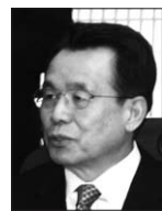
한승수 국무총리(사진)는 2월 3일 조계종 총무원장 지관 스님을 예방해 경제난 등 난관극복을 위한 불교계의 협조를 요청했다.

익산 미륵사지 수습에 불교계가 배제됐다는 지적에 한 총리는 “불교문화재 보존에 최선을 다하겠다. 불교계 요청사항은 언제든지 경청해 시정하겠다”고 답했다. 이외에