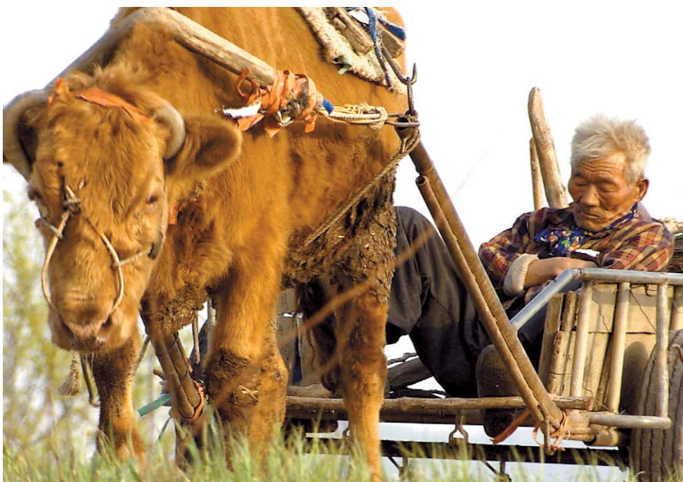
한국 독립영화 사상 최대 기록인 10만 관객을 돌파한 '워낭소리'의 한 장면. 주인공은 최원국 할아버지다.