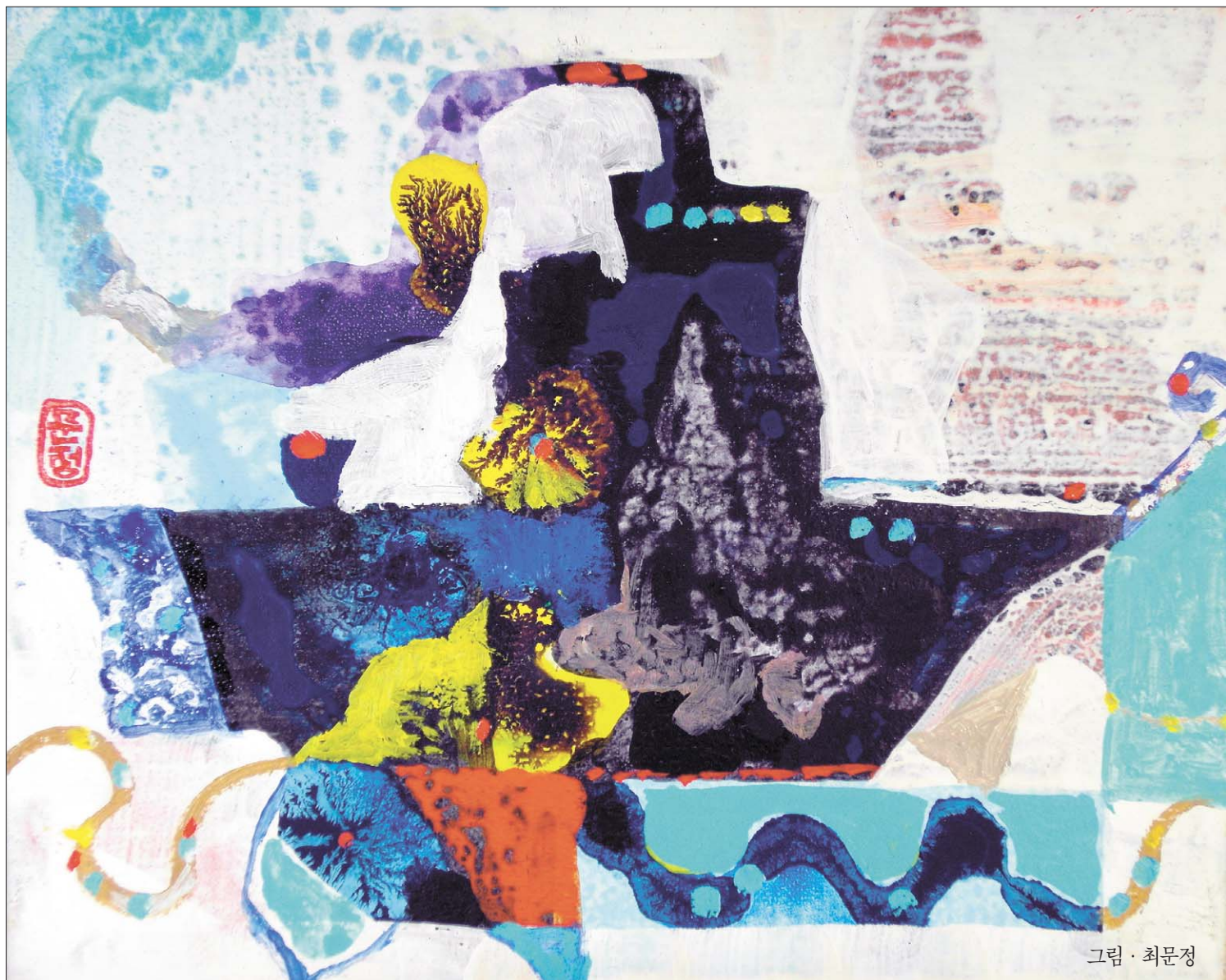
그림 · 최문정

부모는 더 이상 남영에게 결혼을 강요하지 못했다. 더욱이 어머니는 그날 밤 이후 어떤 대사가 남영을 업고 가는 꿈을 세 번이나 꾸었다. “여보, 아무래도 남영이가 스님이 될 것 같아요. 어떤 대사가 남영이를 업고 가는 꿈을 세 번이나 꾸었어요.” “아무래도 남영이가 스님이 될 인연인 것 같소. 그러나 우리가 더 이상 남영이를 붙잡든들 무슨 소용이 있겠소.” 남영은 부모에게 출가를 허락받고는 백양사로 올라갔다. 한 스님이 법당에서 염불을 끝내고 나오면서 얼굴이 상기면 남영을 맞이했다. 남영은 스님에