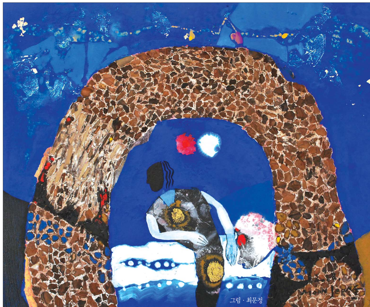
그림 · 최문정

뿐만 아니었다. 방안에 머리카락 한 울 그대로 놔두는 법이 없었다. 남영이 신는 고무신도 항상 마루 밑에 가지런하게 놓였고, 휴한 점 묻어 있지 않았다.