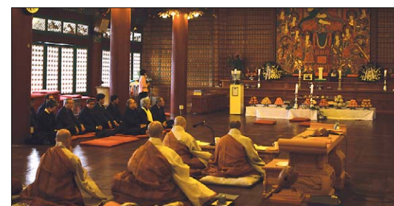
서울 봉은사는 1월 29일 경내 법당에서 해 백남준 선생의 3주기 추모제를 봉행했다. 이날 추모제에는 유족과 일본 백스튜디오 관계자, 봉은사 주지 명진 스님과 100여 신도가 참석했다. 노덕현 기자