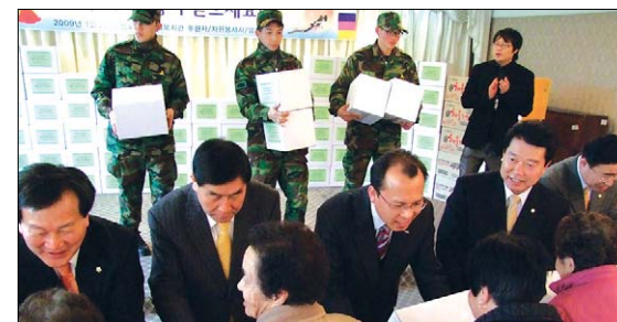
용호종합복지관(이장 해충)은 1월 22일 '설맞이 사랑나눔 한마당'을 개최했다. 행사에서 200여 후원자와 자원봉사자들은 독거노인과 소년소녀가장 등 어려운 이웃 총 400여대에 떡갈떡과 생필품으로 따뜻한 정을 나눴다.