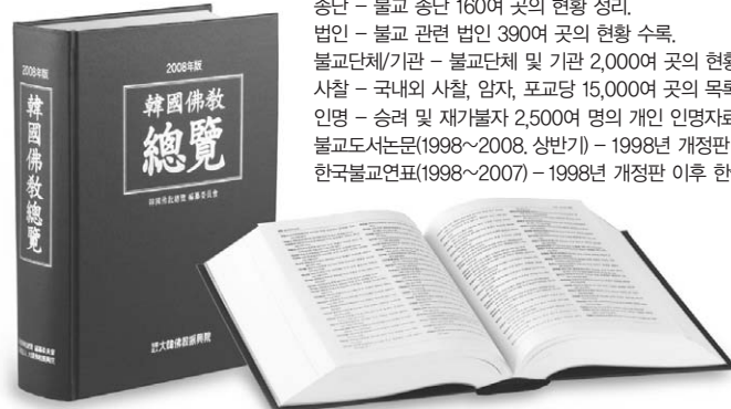
● 4×6배판 양장제본, 1300쪽, 정가 160,000원