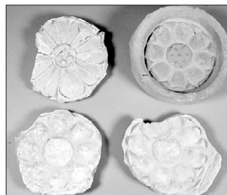
경주공고에서 출토된 연화문 수막새.

박물관 측은 “현재 교정에 놓인 대형 초석과 새로 발견된 지름 1.3m의 대형 적심 등은 큰 건물이 있었던 것을 시사한다”고 말했다.