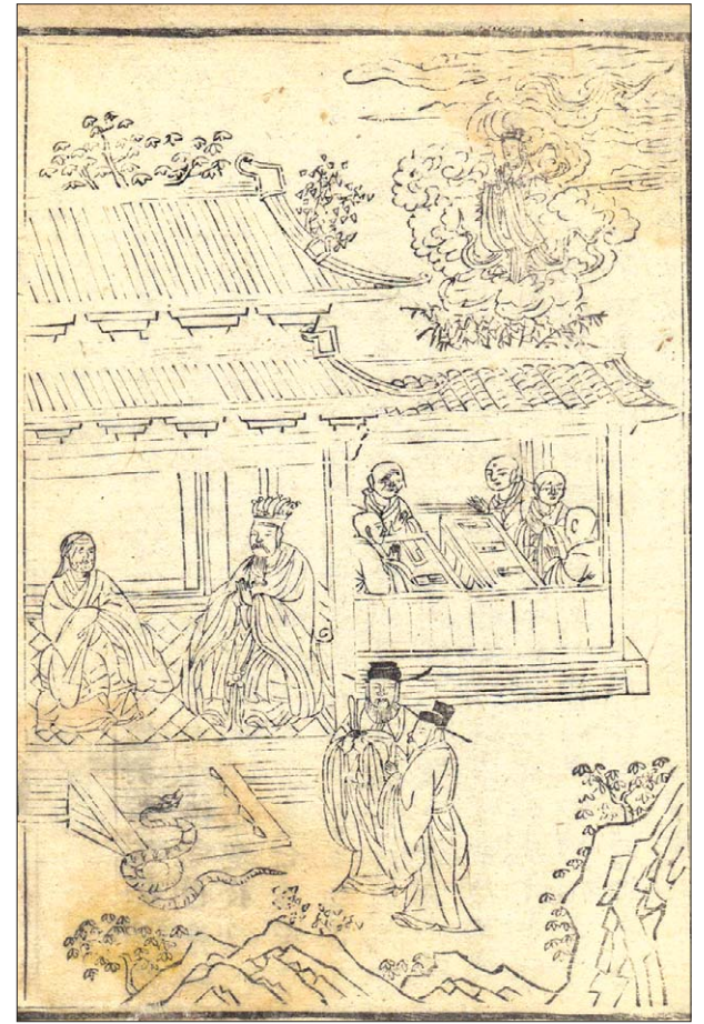
고려판 석씨원류(韓氏源流) 중 양황참법(梁皇懺法) 불암사본 1673년간행. 판액(半幅) 27.2×18.0cm

<석씨원류>에 등장하는 이 삽화는 양(梁)나라 무제(武帝)가 부인의 명복을 빌기 위해 만든 '자비도량참법'의 제자 연기를 시간대별로 설명하고 있다. 삽화를 살펴보면 양무제의 황후 치씨가 구렁이로 나타난 모습과 양무제가 지(誌)스님으로부터 법문을 듣고 '자비도량참법'을 만들어 스님들에게 기도하게 해치 황후가 모든 죄업을 씻고 도리천에 환생하는 장면이 표현되어 있다. '자비도량참법'은 경전을 읽으면서 죄를 참회하는 불교의식이다. 이를 수행하면 죄가 없어지고 복이 생겨난다고 하며, 죽은 사람의 영혼을 구제해 극락으로 인도함으로써 고통으로부터 벗어날 수 있다는 공덕기원의 뜻을 담고 있다.