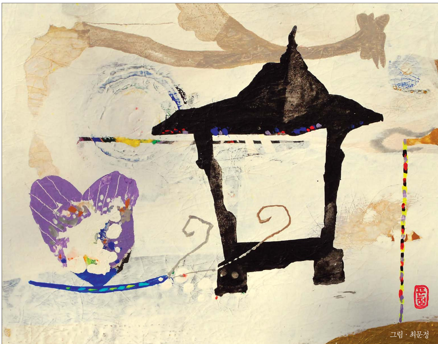
그림 · 최문정

사진에는 사면불 위로 달무리 같은 둥근 무지개가 떠 있었다. 순간, 대연 거사는 부처의 진신사리에 대한 의혹이 눈 녹듯 사라지는 것을 느꼈다. 의혹이