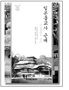
동국대출판부가 출간한 ‘일본불교사 근대’.

사실을 중심으로 일본불교연구를 진행한 반면 일본은 한국에서의 불교유입에 비중을 크게 두고 있지 않다”며 “일본불교와 한국불교의 괴리가 크다”고 지적했다. 이어 유 연구교수는 “현재 일본은 불교적 정신이 생활화된 국가로서 경제적 성장을 발판으로 국제 사회에서 정치·문화의 힘을 확장해가고 있다”며 일본불교를 정확히 이해할 것을 주문했다. (02)2260-3483 조동섭 기자