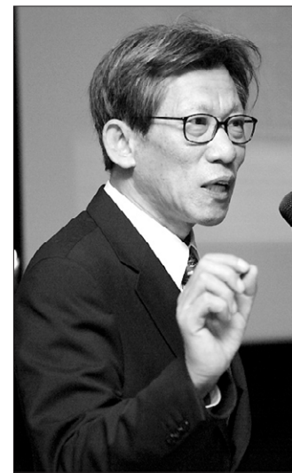
구립 25일 봉은사에서 ‘고려불화’와 관련해 특강한 유홍준 前 문화재청장.

고려불화는 2m 높이의 작은 탕화가 대부분이다. 원나라 시대 저술된 <도화견문록>에 고려불화를 두고 “섬세하고 화려했다”고 표현했을 정도로 고려불화는 예로부터 예