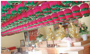
연등 자동 승강장치 _ 대구 장성사