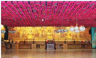
연등 자동 승강장치 _ 서울 화계사