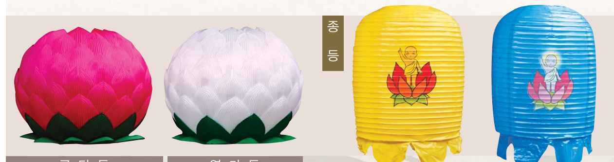
공 단 등