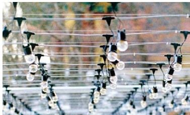
외부에 시공된 전선케이블

찬덕연등에서는 KS케이블을 사용하여 가장 안전하게 전문 기술인에 의해 직접 감독 시공합니다.