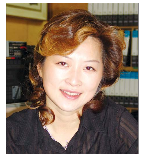
봉 스님에게 불화를 배웠다.

이화여대, 동국대 문화예술대학원을 거쳐 고려대 정책대학원 CRO 과정을 이수한 최 화백은 만