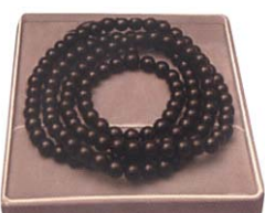
흑단목108염주 단주 흑단무늬목 / 흑단무늬목천주 크기 : 8mm×10mm×12mm 55,000원 10mm×10mm×12mm 65,000원 12mm×10mm×12mm 85,000원 흑단무늬목염주는 가격이 저렴하여 보시용으로 많이 사용됩니다.