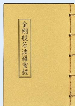
실물크기 (소) 3.5 × 5cm (중) 5 × 7cm

금강 불교예술원에서 세계최초로 99.9%의 금을 나노화 하여 조성된 초소형 경전인 불경금책을 제작보급 하고 있습니다. 부처님 복장용으로 장엄하며 단체 주문시 발원문, 가족명단을 인쇄하여 드립니다. 또한 영가천도, 불사, 소장 및 휴대용으로 가능하며 기타 용도로 사용됩니다. 순금경전을 휴대하는 것만으로도 부처님의 공덕과 불심으로 가피를 입을 수 있으며 호신용으로도 최고입니다. 칸스님 법어, 법구경도 크기별로 주문제작 합니다.