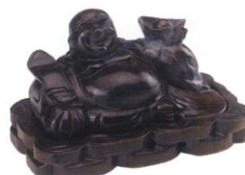
흑단무늬목 포대화상향로 (대) 26×16×16cm 155,000원 → 할인가 125,000원 예술조각품으로 보는 것만으로도 마음이 편안해지고 있는 사람과 나눌 수 있는 미덕 과 복판을 마음을 이루어 주며 입에서 향 이 뿜어져 나와 예쁠시에도 사용됩니다.

부처님께서 즐겨 사용하시던 흑단목은 지구상에 존재하는 나무중 유일하게 氣가 발산되고 최고로 단단하며 자연 문향이 은은하여 아름다우며 동남 아 국가에서 소량만 생산되는 나무중 최고의 명품인 흑단목입니다. ◆ 문의전화 02-722-1850 농협 : 1143-12-049474 송명화