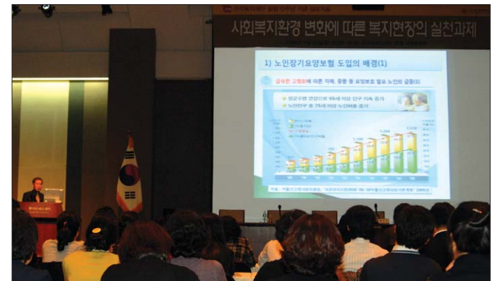
진각복지재단 심포지엄 '사회환경 변화에 따른 복지현장의 실천과제'.

노인장기요양보험제도 도입, 저출산고령화사회 도래 등 급변하는 사회 복지환경 속에서 불교복지현장의 과제를 짚어보는 자리가 마련됐다. 진각복지재단(대표이사 회장·총무원장)은 11월 24일 프레스센터 국제회의장에서 '사회복지환경 변화에 따른 복지현장의 실천과제' 심포지엄을 개최했다.