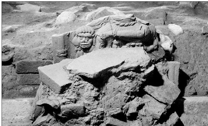
경주 사천왕사지 동탑지에서 발견된 녹유전.

전통적인 통일신라시대 가람인 경주 사천왕사(四天王寺)의 위치와 당시 정방형 쌍탑 기반부 사방에는 녹유전이 배치됐던 사실이 밝혀져 이목을 집중시키고 있다.