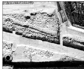
경주 분황사 주자장 부지에서 발굴한 유구 전경.

신라 선덕여왕 3년(634년)에 창건됐던 경주 분황사가 황룡사 못지 않은 큰 사찰이었던 사실이 밝혀졌다.