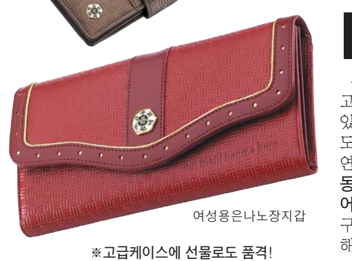
※고급케이스에 선물로도 품격!