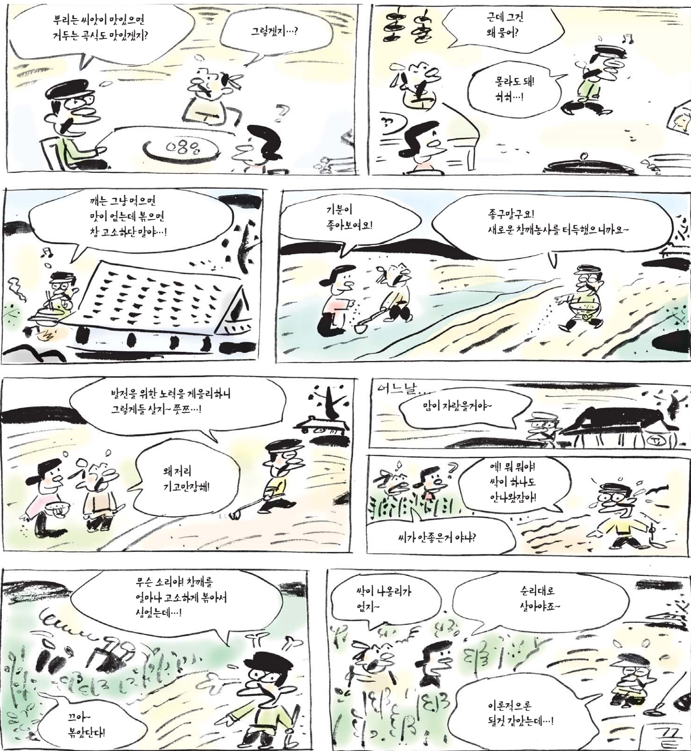
참깨를 볶아서 심은 사람 [백유경(百喻經)]

어떤 어리석은 사람이 깨를 날로 먹었는데 맛이 없었다. 그래서 깨를 볶아 먹었더니 매우 맛있어 볶아서 땅에 심어 키운 뒤 맛난 것을 얻는 것이 좋겠다'고 생각했다. 그래서 깨를 볶아 심었으나 볶은 참깨에서 싹이 날 리 없었다. 세상 사람도 그러하다. 보살로서 오랜 겁 동안 어려운 행을 닦다가, 그것이 즐겁지 않다 하여 '차라리 아라한이 되어 빨리 생사를 끊으면 그것이 차라리 쉽겠다'고 생각한다. 그래서 부처의 결과를 구하려 하던 것이 끝내는 아무런 결과를 얻지 못한다. 그것은 저 볶은 종자가 다시 날 이치가 없는 것처럼 세상의 어리석은 사람도 그와 같다.