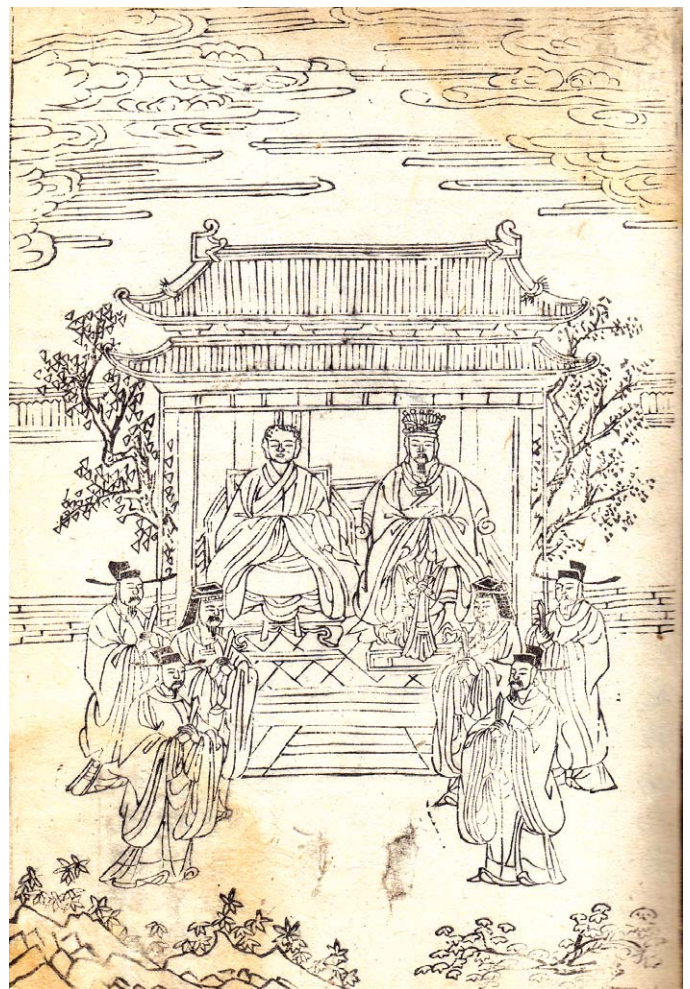
고려화백(高麗華白) 신이(神異) 판화(版畵) 불도징신(佛圖澄神異) 27.2×18.0cm

<석씨원류>에 등장하는 이 삽화는 고승 불도징이 폭군 후조왕 석륵을 감화시켜 그가 무슨 일든 받드시 자문을 받아 행하며 스님을 '대화상'으로 존중했다는 본문 내용을 왕과 함께 나란히 의자에 앉은 모습으로 표현하고 있다. 불도징은 중앙아시아 쿠차(龜茲: 庫車) 출생. 중국 오호십육국(五胡十六國) 시대에 활약한 승려로 불도등(佛圖澄), 부도징(浮圖澄)으로도 불렸다. 북인도 카슈미르 등지에서 수학, 310년 위양(魏陽)에 이르러 여러 가지 신이(神異)한 행적을 보이며 불교의 덕을 넓혔다. 뒤에 북방 민족을 통일한 후조왕(後趙王) 석륵(石勒)의 신봉(信奉)을 얻어 고문이 되고, 군정(軍政)에도 참여해 그의 패업(霸業)을 도와 더욱 신임을 얻었다. 이어서 석호왕(石虎王)에게도 깊은 존송(尊崇)을 받아 역내(域內)의 절에서 조정(朝廷)에 참여했다. 폭군이던 석륵과 석호를 교화시켜, 그때까지 허용되지 않던 한인(漢人) 출가를 허락하도록 힘썼으며, 문화 수준이 낮은 북방민족을 교화해, 불교를 민중 속으로 퍼가는데 공헌했다. 38년 동안 893개 절을 건립, 중국 초기불교 발전의 중심이 됐으며, 수백 명의 문화생 가운데서 도안(道安), 축법태(竺法汰), 법화(法和), 법상(法常) 등 동진(東晉)시대를 대표하는 승려를 배출했다. 본문에 '영가 연간에 낙양