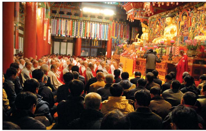
천태종도 2000여 명은 12월 5일 구인사 설법보전에서 동안거 결제식을 거행했다.