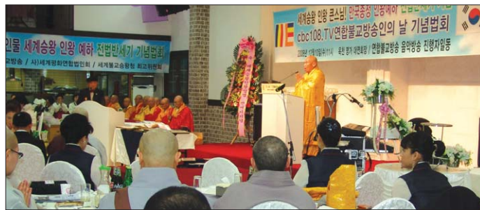
12월 10일 열린 ‘연합불교방송의 날’ 기념법회.

연합불교방송(대표 황덕 · 울산 천마사 조실)이 12월 10일 충북 옥천 명가에서 ‘연합불교방송의 날’ 기념법회를 봉행했다.