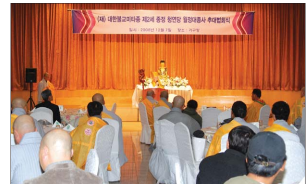
대한불교미타종은 12월 7일 거구장 컨벤션센터에서 월정 종정추대법회를 봉행했다.

대한불교미타종 종정 추대법회가 12월 7일 신촌 거구장 컨벤션센터에서 봉행됐다.