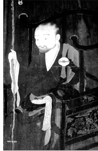
보조 지눌 스님 진영.

김희성 교수는 지눌과 엑카르트, 라마나의 사상을 비교했다. 김 교수는 “절대와 상대의 완벽한 합일이라는 점에서 지눌과 라마나의 사상은 일치한다. 개신교 신비주의를 대표하는 엑카르트 역시 그 궤를 같이해 연구할 수 있다”고 말했다. 최병현 교수와 법산 스님은 각각 지눌과 혜심의 사상적 연결고리와 보조사상