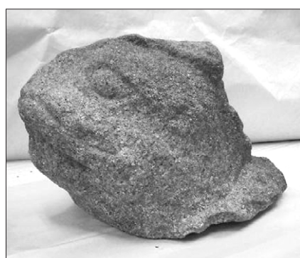
경주 무장사 아미타불조상사적비 비신 복원을 위한 현장 조사중 발견된 거북머리.

문화재청 관계자는 “발견된 머리는 귀부 양식이 거북머리에서 용머리로 변화해 가는 중간단계 모습을 보여 주는 자료로 학술적 가치가 매우 크다”며 “2009년 비신 복원 사업 때 발견한 머리 부분의 제자리를