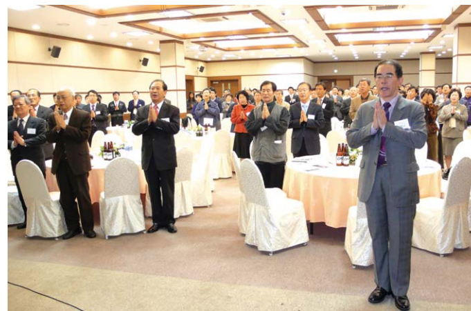
서울대 총불교학생회는 11월 15일 서울대 교수회관에서 50주년 창립제를 개최했다.

서울대학교 총불교학생회가 2023년 착공, 2025년 준공을 목표로 생활·수행 공간 ‘21세기 행복발전소 관악센터 건립’을 선포했다. 관악센터는 불법을 공부하기 위한 기숙사 및 수행센터로, 총불교학생회 학생들에게 경제적인 어려움 없이 학업과 불교 공부에 전념할 수 있는 환경을 제공할 예정이다.