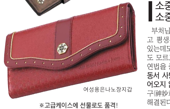
※고급케이스에 선물로도 품격!