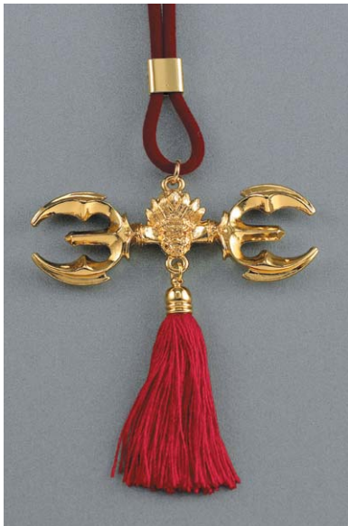
부처님 제1의 비방법구!

경기가 너무없어, 장사가 너무안돼, 문을 닫아야겠어, 요즘 사업을 하는 중생들의 푸념이다. 반면 목도 알 좋고 불경 기에도 흥왕을 누리는 점포와 사업장도 많다. 풍수학적으로 보면 부자가 되는 터가 있고, 패망하는 터가 있다. 그리고 항상 겨우겨우 먹고사는 터가 있다. 한 건물 한지붕 밑에서도 좋은터가 있어 사업이 잘되고 장사가 흥왕하는 것을 볼 수 있다. 장사가 안되는 자리를 보면