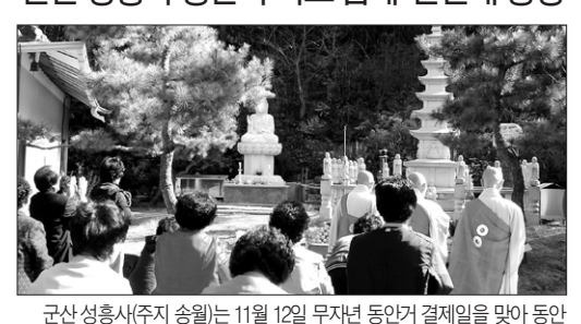
군산 성흥사주지 송월은 11월 12일 무자년 동안거 결제일을 맞아 동안거 기도 입제와 산신제를 봉행했다. 군산지역 사부대중 200여 명이 동참해 가족의 안녕과 군산시의 발전을 기원했다.