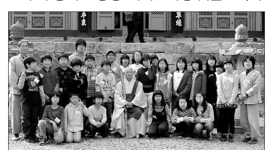
원주구룡사주지 원행은 11월 8-9일 원주원주초등학교 6학년 학생 40여명과 고려대 국제대학원 글로벌발리치 학원생인도 글씨관심, 프랑스 니콜라 스닌앤반호 등 5명을 대상으로 템플스테이를 실시했다. 이상연기자