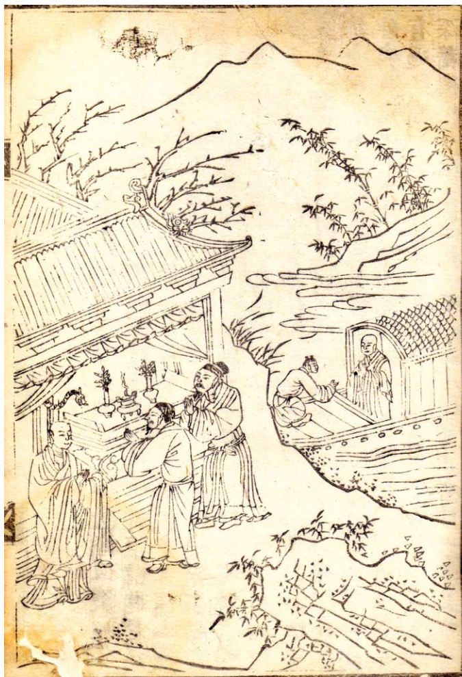
고려시대 불교미술관 소장 <신비관화(神秘觀畵)> 중 공정도망(鄭亭度蟒) 민 불암사면 1673년경(庚申) 비록(半幅) 27.2×18.0cm

<석씨원류>에 등장하는 이 삽화는 고승 안세고가 공정호에서 구렁이 모습으로 나타난 호수의 신을 제도하는 장면이 사실적으로 묘사되어 있다. 안세고(安世高)는 이름 청(淸), 자는 세고로 이란 북동부에 있던 안식국(安息國·파르티아)의 왕자였으나 숙부에게 왕위를 양보하고 출가해 아비담(阿毘曇·經律論 중 논부의 총칭) 연구와 선정(禪定)에 힘썼다고 하며, 후한 시대인 148년경 중국 뤼양(洛陽)에 정착한 후 20여 년간 30여 부(部)의 경전을 한역(漢譯)해, 우리에게 중국 초기의 불전(佛典) 번역자로 알려져 있다. 본문을 살펴보면 영제 말년 관락지방이 어지러워지자 뱀길을 통해 여산에 당도한 후 예전에 함께 공부한 동료로 제도하기 위해 공정호에 이르렀다. 호수를 지키는 신은 안세고에게 "나는 지난 세상에 그대와 함께 출가해 도를 배웠다. 나는 보시하기를 좋아하고 성질이 노여워하는 일이 많았다. 그리하여 지금은 이곳의 묘신이 돼 100리를 관할하고 있다. 그러나 과보로 받은 형체가 지극히 추악하다. 곧 죽게 돼 반드시 지옥에 들어갈 것이다. 나에게 몇 필의 비단과 아울러 은갖 보물이 있으니 이것으로 나를 대신해 탐을 조성하고 집을 지어 나를 좋은 곳에 태어나게 해주었으면 좋겠다"고 발원하자 안세고가 뱀어 소리를 내어 염불을 올리니 구렁이는 슬픈