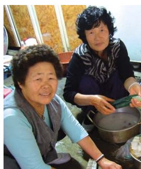
종협이 보살님 댁 부엌에 이십전심 함박웃음이 피어난다.

어든 노모와 친정 같은 절로 떠난 여행이 틀날. 종협이 보살님이 이른 아침부터 절에 당도했다. 제사가 있기 때문이라.