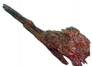
불가의 신성한 5단향을 찾아서 맺은 침향의 인연이 신비롭다.

전설에 의하면, 애초에 침향은 부처님 진신사리처럼 세상의 모든 이들이 천상의 향을 고루 나눌 수 있도록 작게 만들어 세상에 보내졌다고 한다.