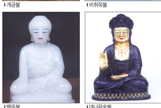
규격 : 소불 - 5치, 7치, 9치, 1자(108-1,000불) 대불 - 2자, 2자반, 3자, 3자반(법당 안)