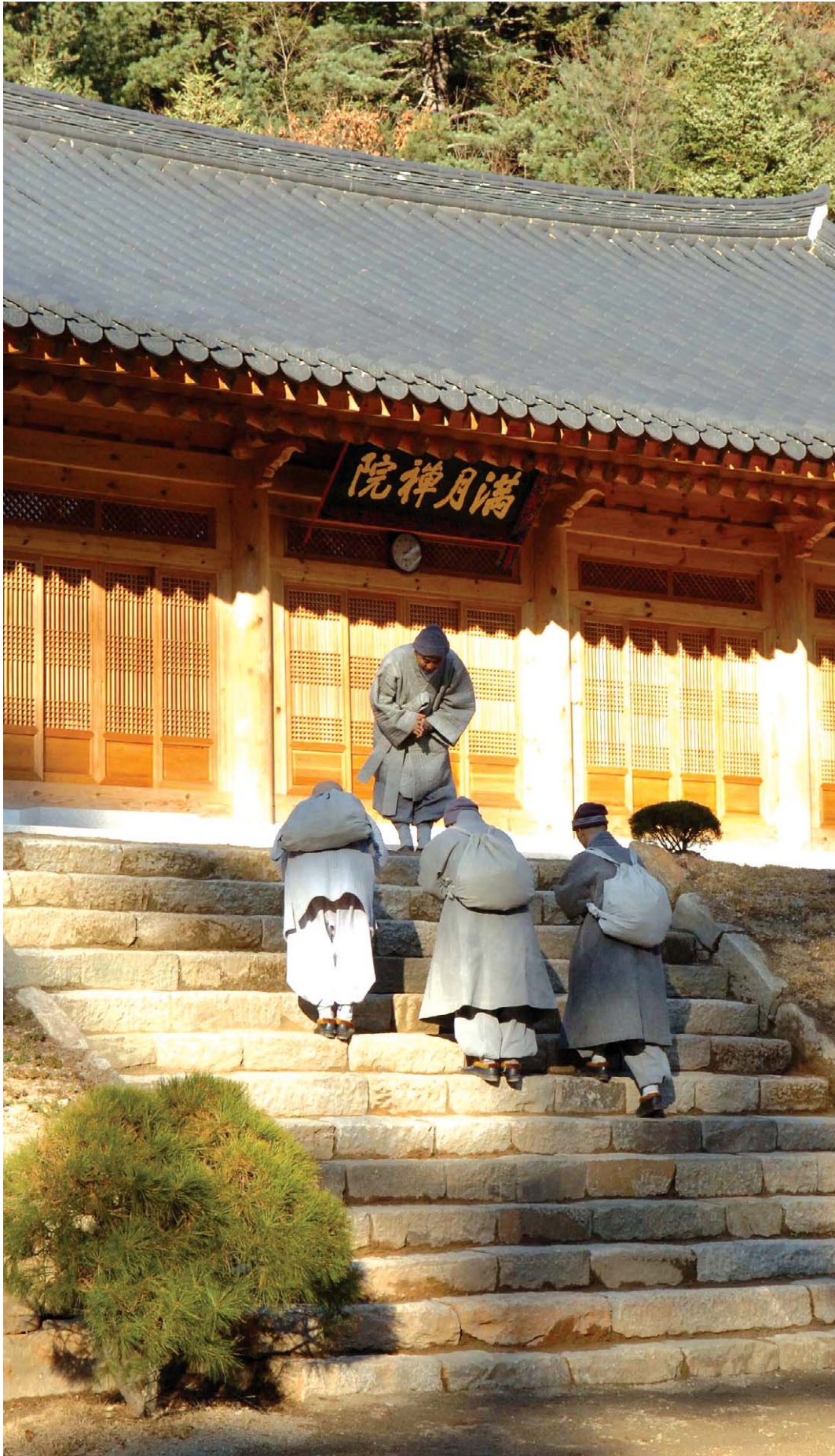
무자년 동안거 입제를 하루 앞둔 11월 11일, 오대산 월정사 주지 정념 스님(맨 위)이 한국전쟁 때 소실됐던 금강선원을 복원해 10월 18일 개원한 만월선원에 방부 들이러 온 운수납자들을 맞이하고있다.