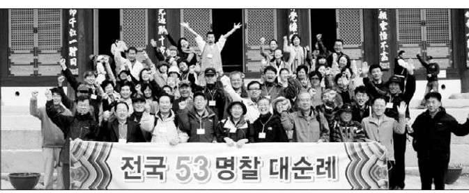
대불련총동문회가 10년간 53명찰을 순례하는 구법여행에 나섰다. 사진은 법주사 순례모습.

한국대학생불교연합회 총동문회(회장 전보삼)는 11월 2일 충남 보은 법주사에서 53명찰 순례법회를 봉행하고 10년간 53명찰 순례의 길을 떠났다.