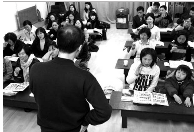
원심회의 수화교육 장면.

이웃 종교에서는 이미 수화 포교사를 전문적으로 배양해, 각종 종교행사에서 활동중이지만 불교계 현실은 암울하지만 하다. 종단 차원에서 청각장애인 포교를 위해 체계적인 도움이 절실하다. 가장 시급한 것은 절대적인 수화 전문 인력 부족이다. 법불교대회 등 큰 법회에서 수화통역은 당연히 있어야 하는 상황이지만 불교계는 인력부족으로 벽에 부딪힌 상황이다. 불교계를 대표해 각종행사에 나서지만 회장을 비롯해 2명의