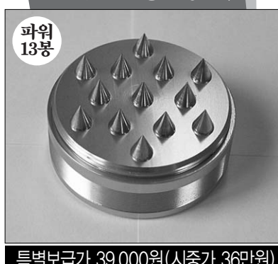
특별보급가 39,000원 (시중가 36만원)