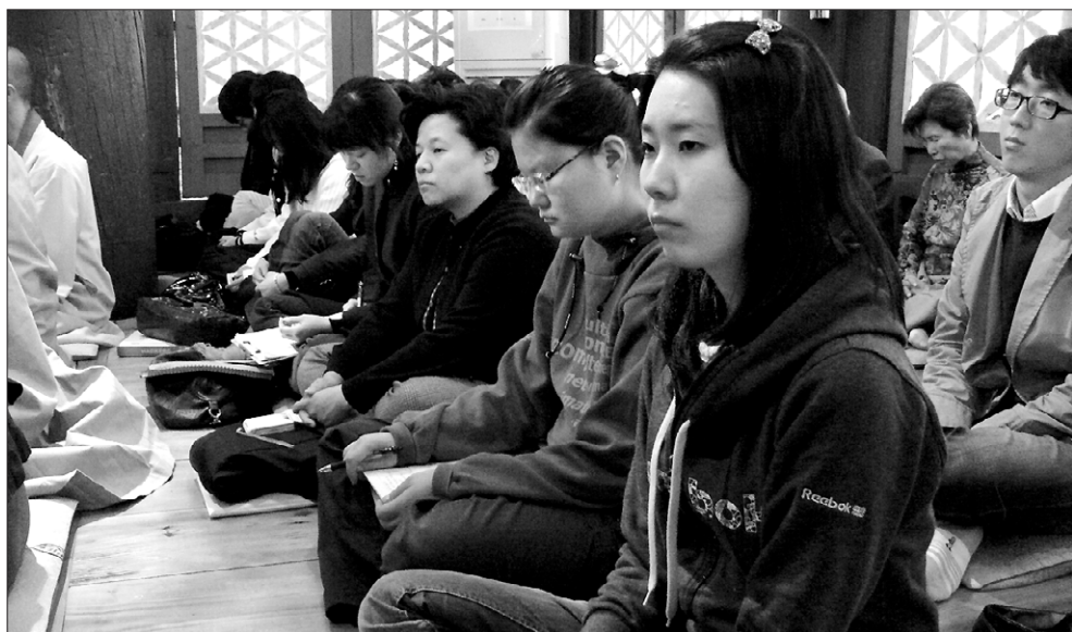
위빠사나 수행을 체험하고자 정각원을 찾은 동국인 가족들.