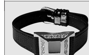
△ POLA 팔찌