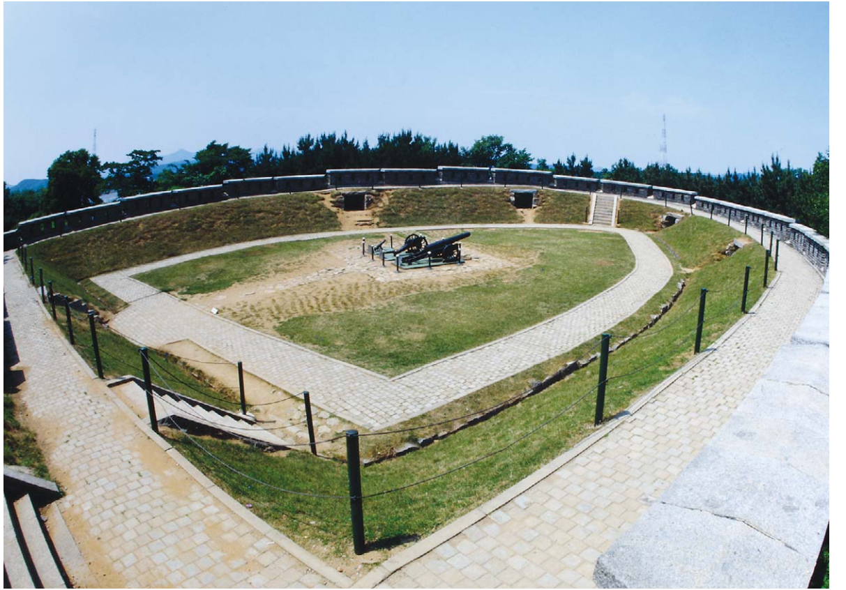
강화도에 있는 광성보

마지막 수단으로 영순에게 매달릴 수밖에 없었다. 강화유수는 영순이를 설 득하고 영순이는 원범이를 타이르는 행 국이 됐다. 원범이를 모셔갈 봉영일행이 강화도에 처음 당도했을 때 영순이 역시 원범이를 잡아갈 무리라 생각하고 ‘내가 나오라고 할 때까지 꼼짝 말고 있어’라며 깊은 산 속 동굴에 원범이를 밀어 넣었다. 원범이에게 잘 밥을 삼배 보자기에 싸