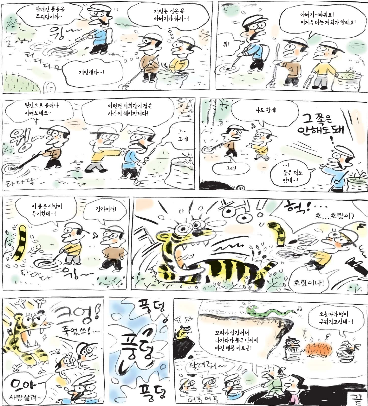
뱀의 머리와 꼬리가 서로 다툼 이야기 [백유경(百喻經)]

어느 날 뱀 꼬리가 그 머리에 말했다. "내가 앞서 가자겠다." 머리가 말하기를, "내가 언제나 앞에서 갔는데 갑자기 왜 그러느냐?" 머리와 꼬리는 서로 싸웠다. 끝내 머리가 앞에서 가려하자, 꼬리는 나무를 감고 버렸다. 하는 수 없이 머리가 양보했다. 결국 꼬리가 앞서 가다가 불구덩이를 보지 못하고 떨어져 타 죽었다. 스승과 제자도 그와 같다. 제자들은, "스승은 나이가 많다고 해 늘 앞에 있지만, 제자인 우리들이 젊으므로 길잡이가 돼야 한다"고 한다. 하지만 계율에 익숙치 못한 젊은이는 항상 계율을 범하다가 곧 서로 끌고 지옥에 들어간다.