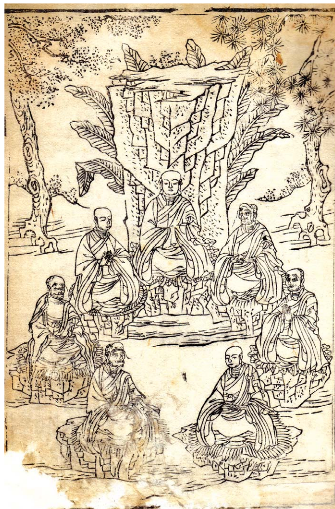
고려시대 불교사상 <석씨원류(石溪元流)> 중 제조유방(譙毗遺芳)의 면면(面緘) 1673년경, 민국(民國) 27.2.18.0cm

<석씨원류>에 등장하는 이 삽화는 부처님 법이 마하가섭존자에게 전해진 후 인도를 거쳐 중국에 들어와 여러 조사들에 의해 전수되고 이어져 내려오는 모습을 소나무와 바위를 배경으로 표현하고 있다. 본문의 내용을 간추려 보면 "세존인 석가여래가 쌍림에서 입멸하고 대법이 동방으로 흘러들어 오게 됐다. 한나라 명제는 꿈에 금인을 만났고, 여러 조사들이 뒤이어 세상에 나와 이도를 전수하고 호지했다. 마등(摩騰)은 경을 번역했고, 도징(竺淨)은 신이한 도술을 지니고 있었으며, 천태지의(天台智顛) 대사는 <법화경>을 크게 흥법했다. 보리달마(菩提達磨)는 부처님의 심인(心印)을 전했다. 현장(玄奘) 법사는 인도에서 경을 가져와 대사는사에서 눈을 지었다. 소경사와 영지사에서는 계율을 전수·호지했다. 청량산의 현수(賢首) 스님은 <화엄경>을 널리 열었고, 백장(百丈) 선사는 처음 백장청규를 세웠다." 본문에 실린 조사들의 면면을 다시 살펴보면 마등은 <사십이장경(四十二章經)> 등을 번역했다. 이것이 중국 역경의 시초였다. 도징은 한인(漢人)의 출가를 허락하도록 했고 북방민족을 불교문화로 교화하는 등 중국 초기불교 발전에 큰 공헌을 했다. 천태지의 선사는 천태종을 열어 <법화경>을 널리 전법했