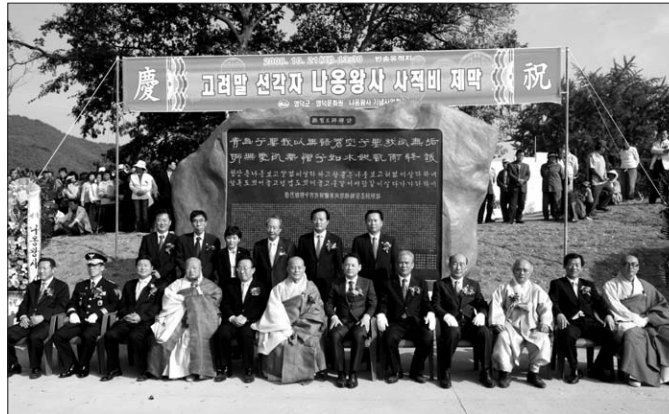
영덕군은 10월 21일 창수면 반송정에서 나옹 왕사 사적비 제막식을 가졌다.

영덕군은 사적비 제막식을 시작으로 문화관광부와 협의해 나옹 왕사가 장강한 장유사 인근에 문화공원을 조성하는 등 다양한 내용 문화