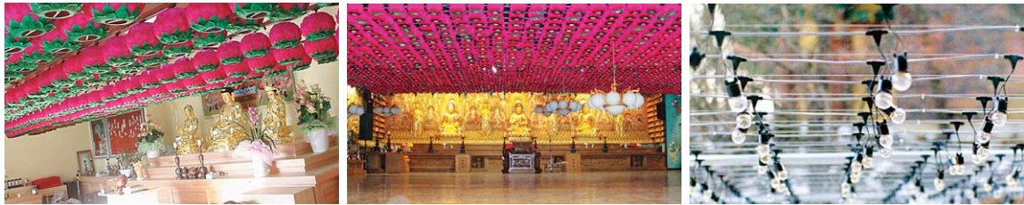
연등 자동 승강장치 _ 대구 정성사 연등 자동 승강장치 _ 서울 화계사 외부 시공된 전선케이블

찬덕연등에서는 KS케이블을 사용하여 가장 안전하게 전문 기술인에 의해 직접 감독 시공합니다.