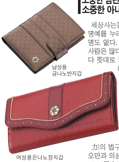
※ 고급케이스에 선물로도 품격!

방에서 들어오지만 연이 안되는 지갑은 돈은 들어오지 않고 고통만준다. 불경, 다라니의 근본은 신묘장구(神妙章句)로 글자 그대로 신묘하게 묘한일이 일어나 해결된다는 뜻이다. 신묘장구 다라니 지갑에는 대비신력의 부처님법구인 신묘한 문자가 들어 있어 백배, 천배, 만배,의 무량 대복을 받으며 물질로 인한 근심과 고통을 소멸하게 만든 영험의 지갑이다. 점안불공과 축원불공을 마치고 출시한지 5년간 수한 영험으로 화제를 낳고 있는 신묘장구 다라니부자지갑은 동서사방에서 돈이 들어오게하는 비방의 법구가 지갑 내부 상단에 들어 있고 막혔던 모든 일들이 풀리게 하는 영험의 법구가 내부에 들어있으며 음양의 조화로 원하는 소원이 이루어지게하는 왕진언이 지갑 앞면에 들어있다. 천원 고급소가죽에 금나노, 은나노 처리 까지한 일반 지갑과는 비교될 수 없게 내부도 잘 꾸며져 있고 불광사에서 지갑 사용하실 분 또는 선물 받으신분의 생명과 생년월일을 알려주시면 그분의 소원이 성취되게 100일간 축원불공을 올려드리다. 전화로 신청하면 지갑은 택배로 받아 사용하고 축원불공은 신청다음날 새벽부터 올려드리다. 납성용 금나노 지갑65,000원 여성용은나노장지갑95,000원 문의(02)741-4488 (사찰스님 신청시 20% 할인) 입금은행 : 032-12-193445 이상하 (신용카드 분할가)