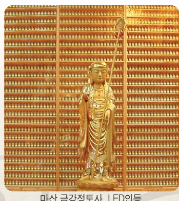
마산 금강정토사 LED인등