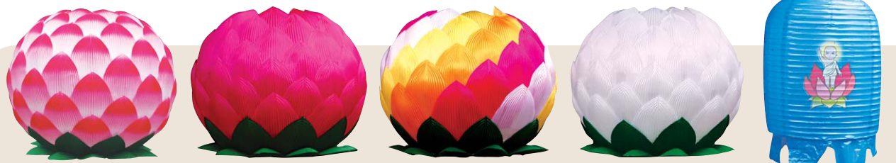
칼라(보카시)연등 공단등 오색공단등 영가등 중등