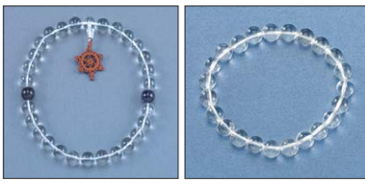
특별선물 : 단주 또는 합장주 탁1

인연의 귀인을 만나 성공하는 인연염주! 건강 장수와 행운이 함께하는 평생염주!