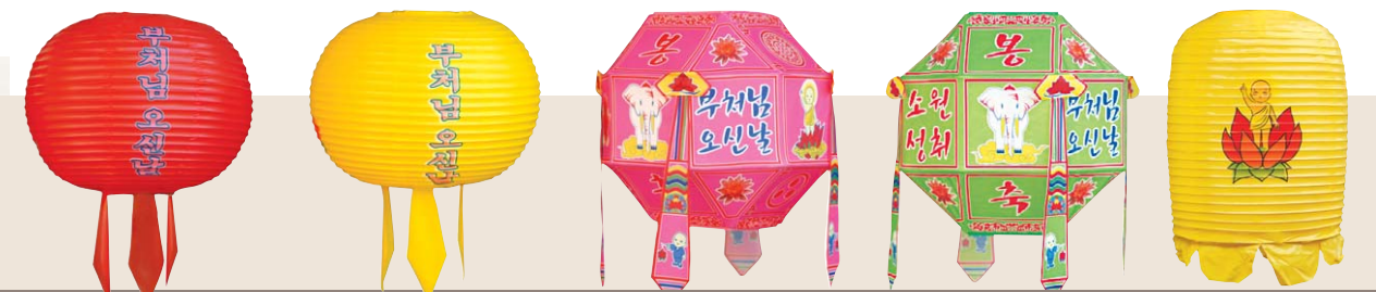
만월등(주름등) 팔각봉축접등 중등