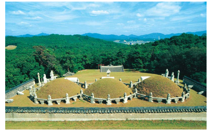
창덕궁 내에 있는 낙선재(위), 헌종의 경릉은 조선왕릉 가운데 원비와 계비를 모신 유일한 삼연릉이다(아래).