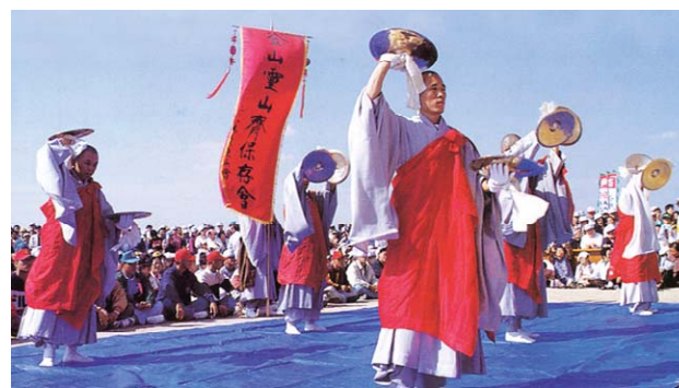
부산시무형문화재 제9호 '부산영산재' 시연 모습.

“나비춤이야 말로 애벌레가 나비가 되는 과정에 추는 춤이므로 중생이 부처가 되는 과정을 비유한 것입니다. 불