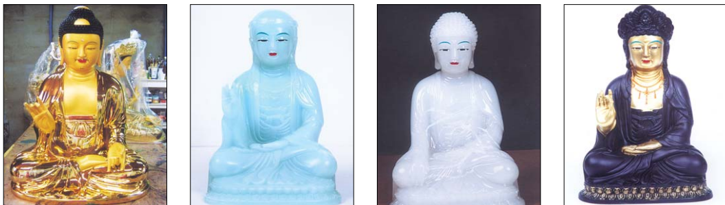
1개금불 1비취옥불 1백옥불 1대나무숯불 규격 : 소불 - 5치, 7치, 9치, 1자(108-1,000불) / 대불 - 2자, 2자반, 3자, 3자반(법당 내)