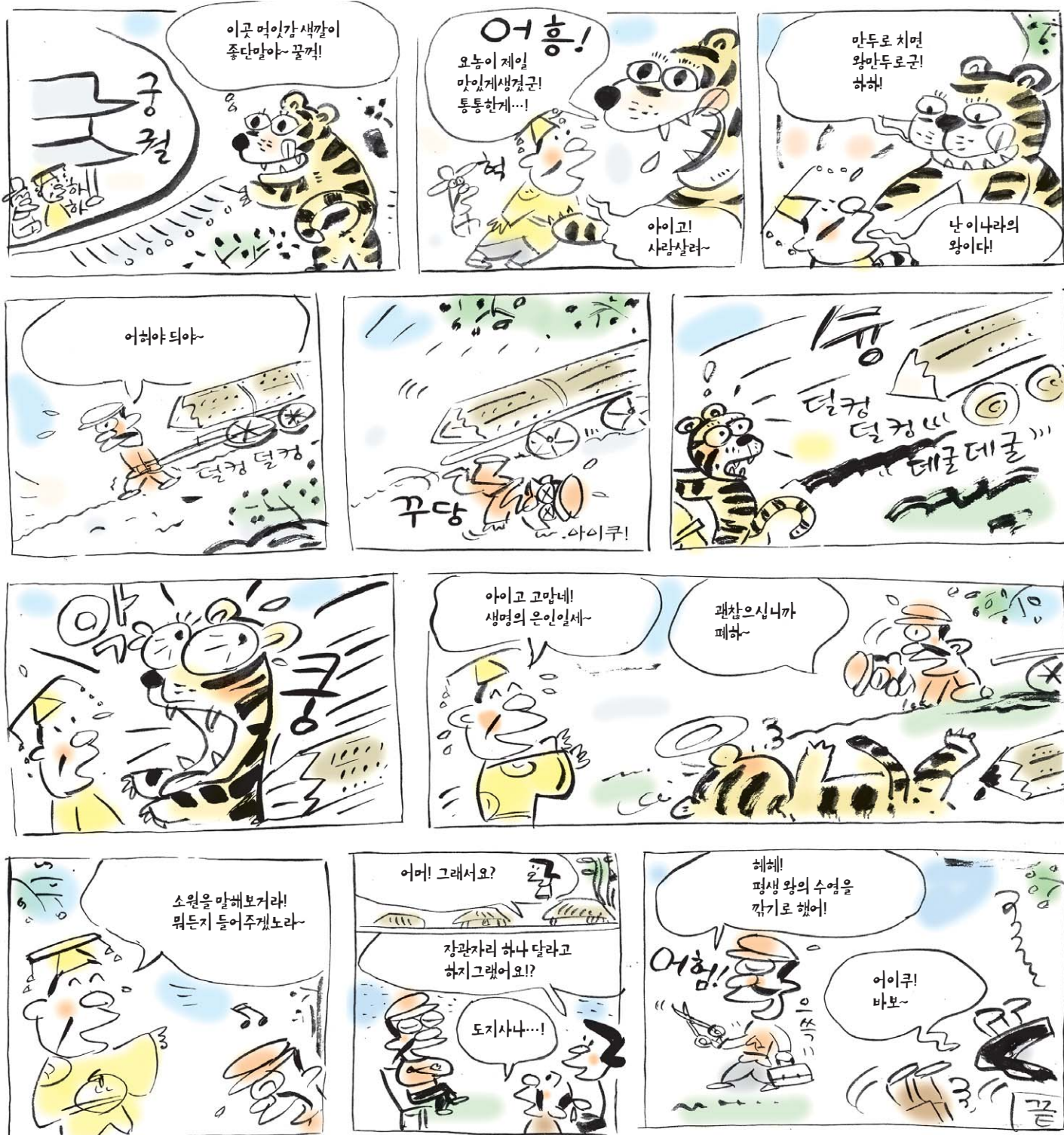
왕의 수염 깎기를 택한 사람 [백유경(百諭經)]

왕의 목숨을 구한 신화가 있었다. 왕은 신하에게 소원을 들어주겠다고 했다. 신하가 답하길 "왕께서 수염을 깎으실 때 나를 시켜 깎도록 해주소서." 왕은 "네가 원한다면 그렇게 하겠다"고 답했다. 세상 사람들은 어리석은 신하를 두고 비웃었다. "나라의 반을 다스리는 대신이나 재상 자리도 얻을 수 있었는데, 어리석은 사람이 일부러 천한 업을 구했다." 어리석은 사람들도 이와 같다. 부처님을 만나거나 부처님이 남긴 법을 만날 수 있더라도 사람 몸 얻기는 어렵다. 그것은 마치 눈 먼 거북이가 떠도는 나무 구멍을 만나는 것과 같다. 만나기 어려운 두 가지를 만났어도 작은 계을 받을 어 죽다 생각할 뿐 열반의 훌륭한 묘한 법을 구하지 않는다.