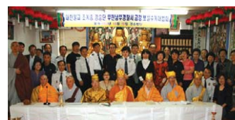
10월 15일 부천 남부경찰서에서 열린 금강·보살수계법회 후 가진 기념촬영.

부천남부경찰서(서장 최경식) 경승위원회(위원장 성인 스님)는 10월 15일 경찰서 법당에서 ‘대한불교조계종 경승단 부천남부경찰서 금강·보살 수계대법회’를 봉행했다.