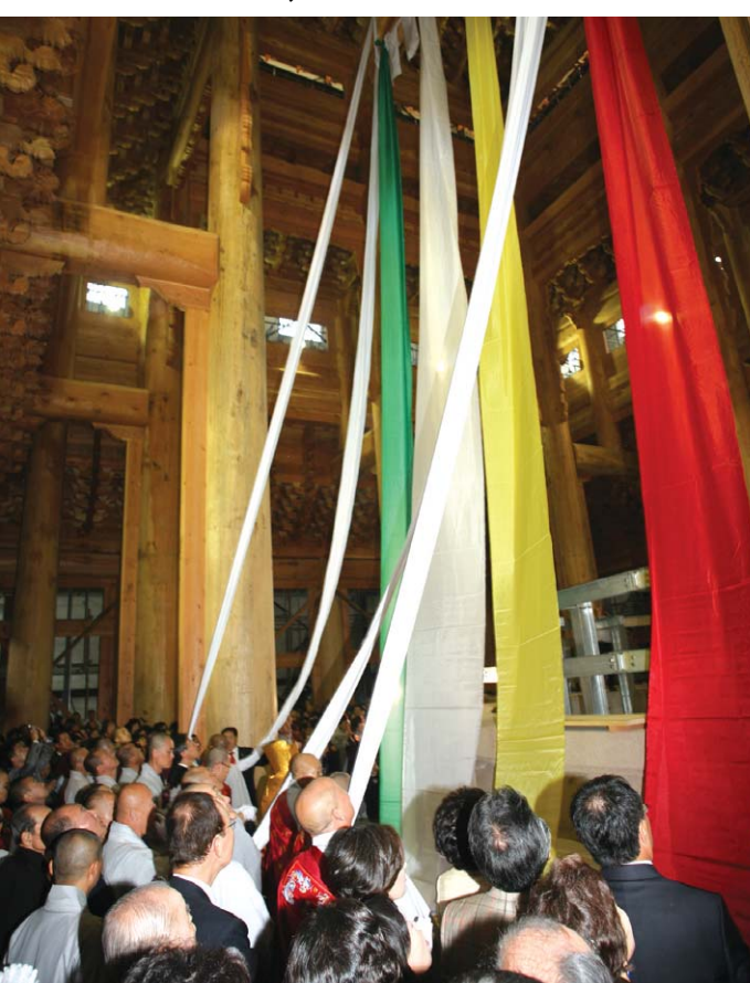
10월 7일 봉행된 분당 대광사 미륵보전 상량식.

천태종 분당 대광사(주지 월산)는 10월 7일 세계최대 다포양식으로 조성되는 미륵보전 상량식을 봉행했다. 이날 법회에는 천태종 종정 도용 스님, 총무원장 정산 스님, 종의회의장 도정 스님, 감사원장 춘광 스님, 이대업 성남시장, 신영수 한나라당 국회의원, 이분회 강원도지사부인 등 사대부중 2천여 명이 동참했다.