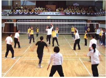
10월 3일 열린 전북 불교대학 체육대회.

전북사암승가회(회장 원행, 금산사 주지)는 10월 3일 무주 예체문화관에서 '하나되어 미래의 지평을 열자'는 전북지역 불교대학 체육대회를 개최했다.