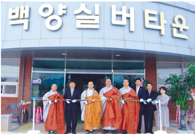
10월 8일 열린 백양실버타운 개원식 테이프 커팅 장면.

원일 스님은 개원사에서 "백양실버타운은 한국불교가 지향하는 부처님 자비를 실천하는 대중생활 불교의 도량이자, 안락한 노후생활 시설"이라며, "아름다운 자연환경 속에서 지역 의료계와 좋은 시