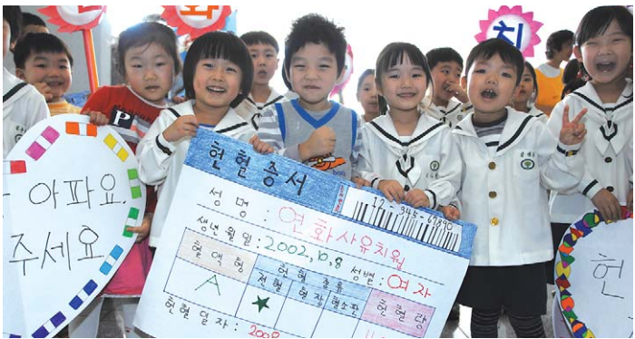
10월 9일 광주시청사에서 열린 골수 및 장기기증 캠페인에서 어린이들이 명예헌혈증을 들고 있다.

"친구가 아파요. 도와주세요." 유치원생들의 팔방팔방한 목소리가 광주시청사에 울려 퍼지는 가운데 난치성 환우들을 위한 생명나눔의 장이 펼쳐졌다.