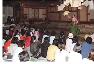
공연을 관람하는 금산사 템플스테이 참가자들.

한편 금산사는 1409주년 개산대재를 18일 대적광전에서 개최한다. 역대 금산사 조사스님들에게 차례를 올리는 것으로 시작되는 금산사 개산대재는 금산사를 창건한 진표율사의 장경정신을 계승하고 부처님