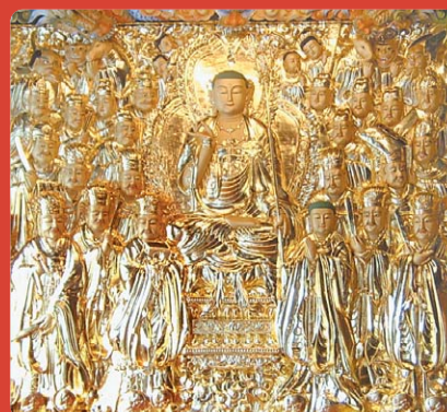
온양 수암사 지장 목탱화

귀의 삼보 하옵고 저희 성불조각원은 불교 목공예를 전문으로하여 저희가 생산하는 모든 작품에는 작은 못하나 사용하지 않고 짜맞춤 공법으로 제작하고 있습니다.