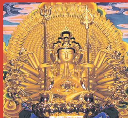
신흥사 천수천안 관세음보살