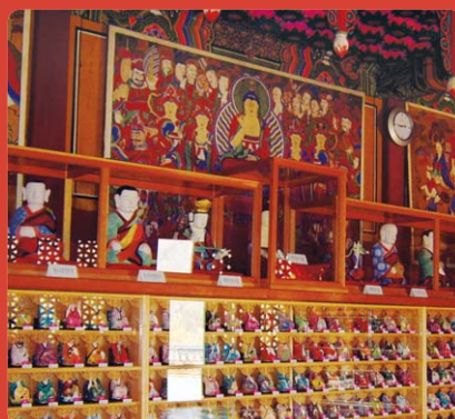
오대산 상원사 500나한