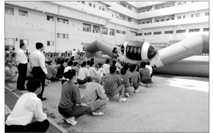
10월 8일 열린 청주여자교도소 수용자 체육대회에서 수용자, 교정위원, 직원이 함께 즐거운 시간을 갖고 있다.