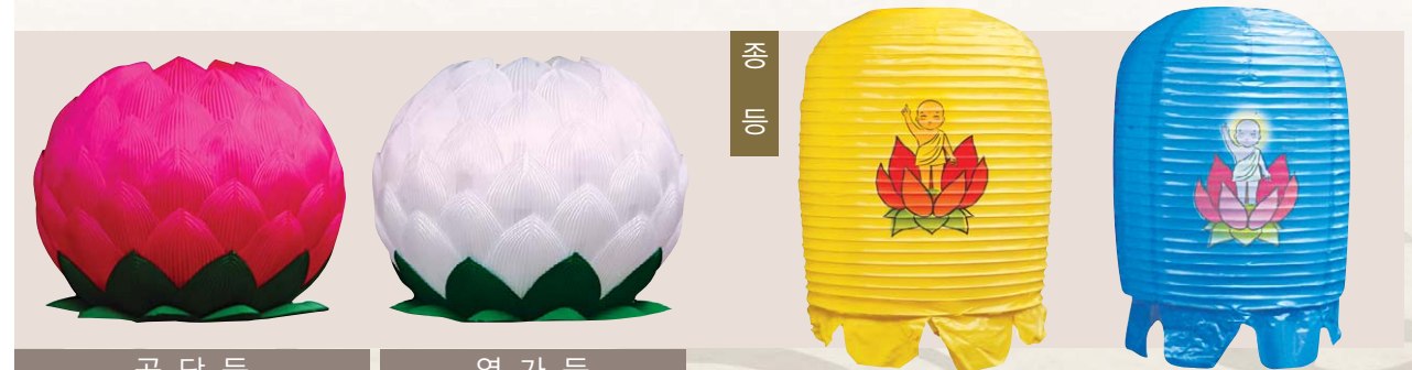
공 단 등