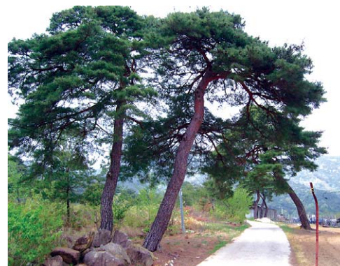
사라질 위기에 처했던 금강선원 앞 소나무 두 그루.

금강선원 가족처럼 여겼던 절 앞 소나무들을 깨야 한다니 눈앞이 캄캄했다. 일부지만 문중터를 사용하고 있어 그네들 뜻을 반대할 수도 없었고, 물색없는 출가자 신분에 소나무를 대신 수도 여건도 아니었다.