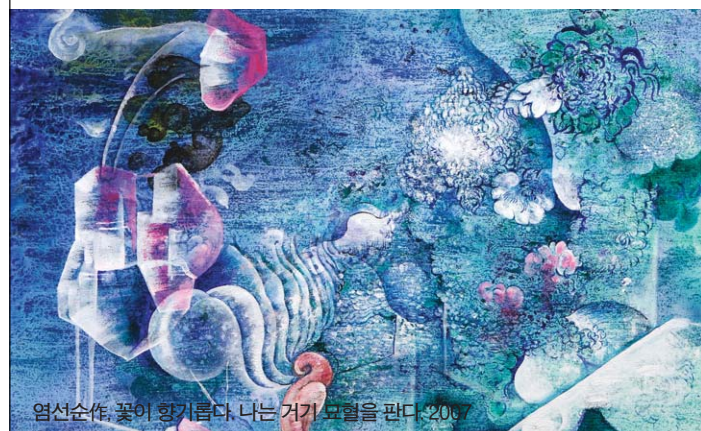
염성순작 꽃이 향기롭다. 나는 거기 묘혈을 판다. 2008

작품 ‘귀족도’는 서정주 시인의 시 ‘귀족도’를 회화로 표현한 것으로 시적 자아의 애절한 갈망과 한을 농축한다. 돌이킬 수 없는 길을 떠난 님을 향한 애절함에 관해 이선영 미술평론가는 “물과 산이 연상되는 풍경 속에 담긴 알의 이미지는 다산을 연상한다”고 분석하며 “서정주 관련 작품에서 자연은 여성의 관능과 중첩된다”고 평했다. 문학을 조형의 언어로 표현함에 있어 화가가 밀착하는 색채 기법은 불분명한 시작과 끝으로 자유와 해방을 호소한다. (02)747-7277 가연숙 기자