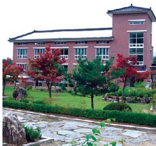
전북 최초의 불교전문실버타운으로 9월 27일 개원한 상락정토마을.