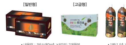
• 내용량 : 1박스(80ml × 60포) 2개입분 • 1병(1.5L)