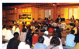
금산사가 2007년 가을 개최한 ‘추억의 템플스테이’ 모습.

연인원 5000명이 동참해 전국적으로 인기가 높은 금산사 템플스테이. 이번 행사에서는 포토그래퍼 이승호 작가의 템플스테이 사진전, 스위스와 독일 국적을 가진 사람들이 ‘베티나와 친구들’의 이색 사물놀이, 요가지