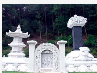
화엄사 중흥조 도광 선사 부도탑비.

한편 화엄사는 1995년에는 서5층석탑(보물 제133호) 보수공사 도중 부처님 진신사리 22과와 성보유물 16종 72점이 발굴되는 등 선교양종 대본산으로서 사격을 더욱 높이고 있다.