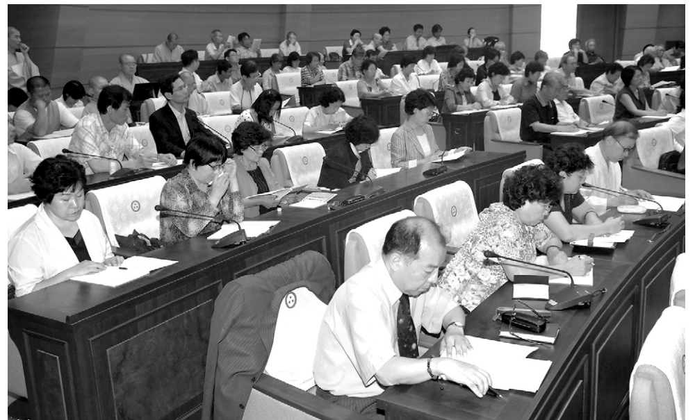
간화선 화두의 기능과 역할을 논한 학술대회가 9월 19일 한국불교역사문화기념관 국제회의장에서 열렸다.