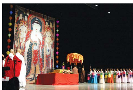
성재문화원이 지난해 7월 19일 KBS부산홀에서 개최한 불심 도론 스님 초청 대법회.

성재문화원은 야단법석을 통해 대중법회문화의 새로운 비전을 제시하고자 설립된 비영리 민간단체로 1999년 고산 대종사 초청법회를 시