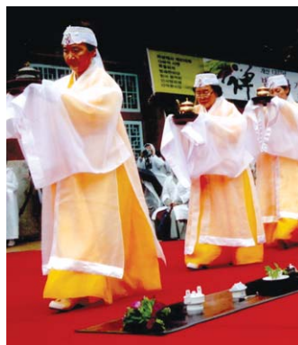
종교로 다가가기 위해 노력해온 범어사 개산대제가 이제 부산을 넘어 세계 속 문화축제로 자리매김하고 있다.

1330년 전 범어사를 창건한 의상대사의 뜻을 기리기 위해 해마다 새로운 주제로 문화와 결합해 친근한