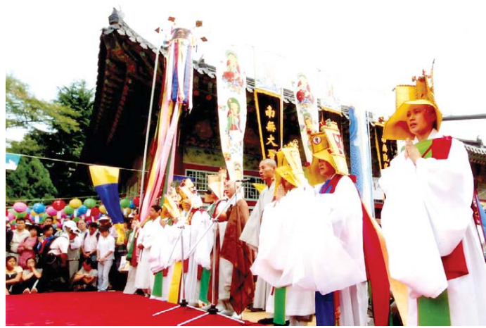
올해 개산대제는 지역문화축제로의 발돋움 준비하고 있다. 사진은 지난해 개산대제의 모습.

이러 노인인날인 10월 2일에는 어르신 장기자랑 및 자비의 쌀 나눔, 영정사진 무료 촬영 등 어르신들을 위한 다채로운 행사가 마련된다.