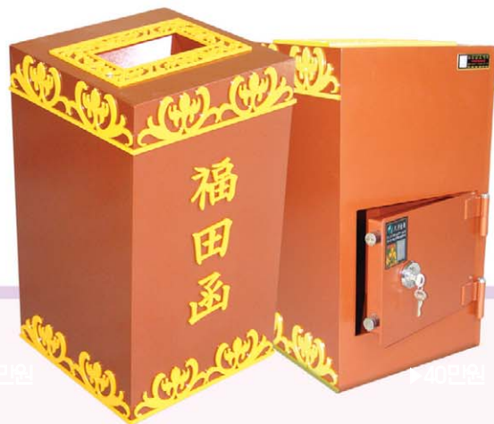
◆ 크기 : 높이620x넓이350x깊이350 / 투입구 : 가로190x세로95