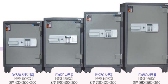
BY630 사무가정용 [중량 100KG] 외부 630x500x500 내부 410x360x335 BY670 사무용 [중량 120KG] 외부 670x500x500 내부 450x360x320 BY750 사무용 [중량 140KG] 외부 750x520x500 내부 550x410x340 BY860 사무용 [중량 160KG] 외부 860x580x510 내부 660x460x340