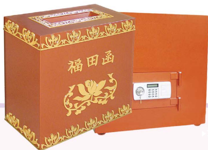
◆ 크기 : 높이700x넓이700x깊이350 / 투입구 : 가로350x세로350