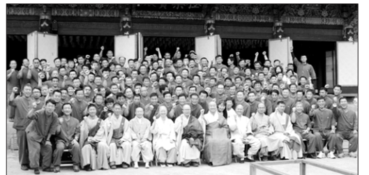
군종특별교구(특별교구장 일면)는 9월 3일~6일 인제 백담사에서 국군준부사관 불자 수련회를 성료했다. 수련회에는 육해공군 준부사관, 군무원 등 200여명이 참석해 자비명상, 차용명상을 체험하고, 군불교 발전을 결의했다. 노덕현 기자