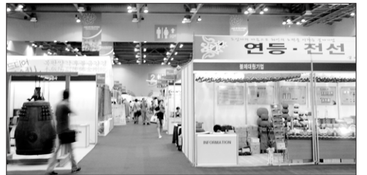
(주)제이엔비전선과 불교신문은 9월 5일부터 8일까지 경기도 고양시 한국국제전시장(KINTEX)에서 '2008한국불교박물관'을 개최했다. 기연숙 기자