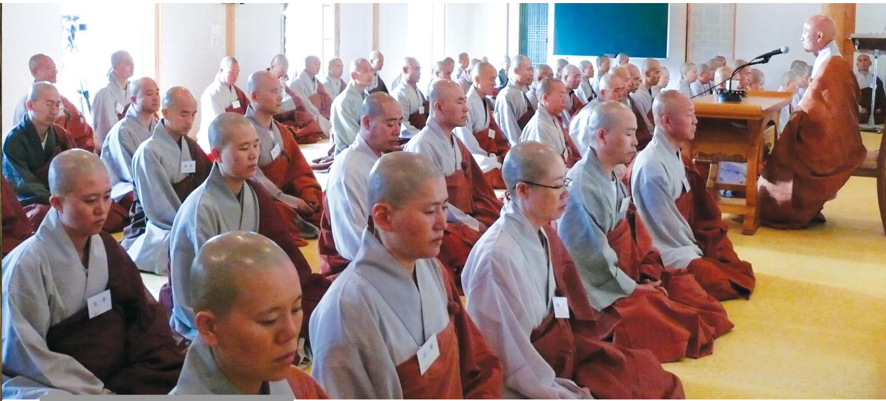
2008 벽송선회 '문없는 문' 열었다